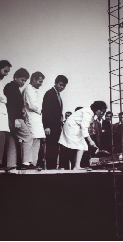
A.Ü Tıp Fakültesi temel atma töreni

Prof. Dr. İhsan Doğramacı'yı anlatırken, onun herkesçe bilinen hayat hikâyesini burada tekrarlamaya lüzum görmüyorum. Onun üstün tahsili, üstlendiği mühim vazifeler, ülkemize sunduğu hizmetler ve arkasında bırakmış olduğu müstesna kurumlar bütün toplumumuzun malumudur. Böyle bir ismi yalnızca kronolojisi içinde okumak da eksik kalır. Esas anlaşılması gereken, onun bu hayat hikâyesi